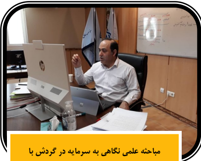
مباحثه علمی نگاهی به سرمایه در گردش با رویکرد نوین- پاییز ۱۴۰۰

۲۷۸۹۱ داخلی ۲۴۹۷-۲۴۵۸- (تلفن گویا ۴۱-۲۲۸۸۱۶۴۰)